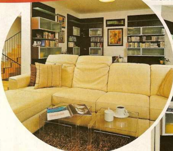
PŘIPRAVILA ARCHITEKTKA HELENA ČERNÍKOVÁ

Čtyřlenná rodina se přestěhovala ze starého činžovního bytu v centru Prahy do nové zástavby rodinných domů. Moderní stavbu, velkoryse řešenou s prosklenými stěnami, však nebylo možné zařídit nábytkem z původního bytu. Proto se majitelé rozhodli pro užití nových trendů v bydlení.